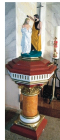
Megújultak templomunkban a stáció képek, a betlehemi barlang és az eddigi fehér keresztelőkút is.