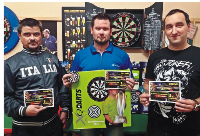
A dartsverseny díjazottjai