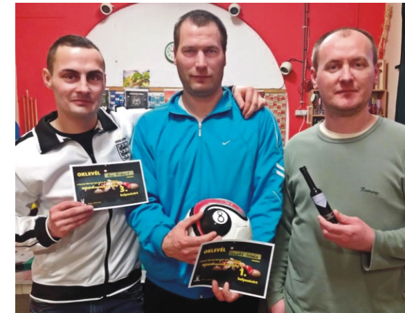
A biliárdverseny díjazottjai