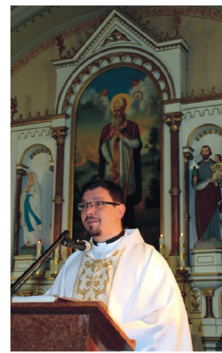
bocsátani-haragudni, megbízni-gyanakodni, együtt érezni-közönybe burkolózni, hinni-kétkelkedni... A választani tudás az igazi tudás.”

A napokban egy barátom küldött nekem egy idézetet, amely így hangzik: „Milyen közel állnak egymáshoz: adni-kapni, ajándékozni-elfenni, tisztelni-megalázni, odafigyelni-elfárni, elengedni-kényszeríteni, meg-