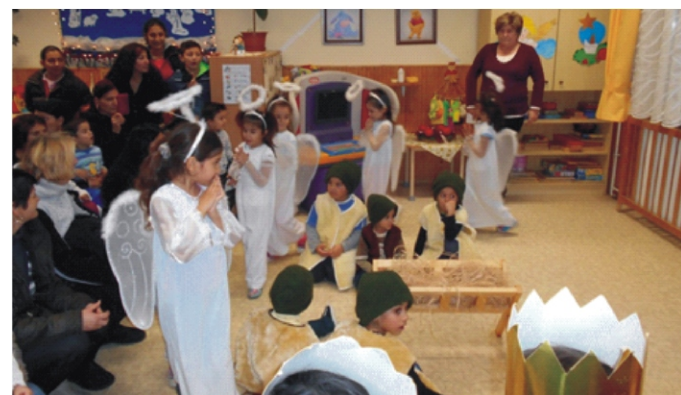
Az óvodában a szülők is megnézhetik az ünnepi műsort