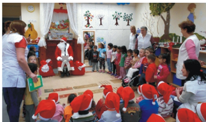
Nagyon örültek a gyerekek a Mikulásnak