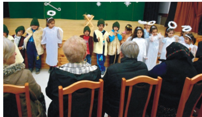
A pásztorjáték végén a színpad előtt köszöntük meg a figyelmet