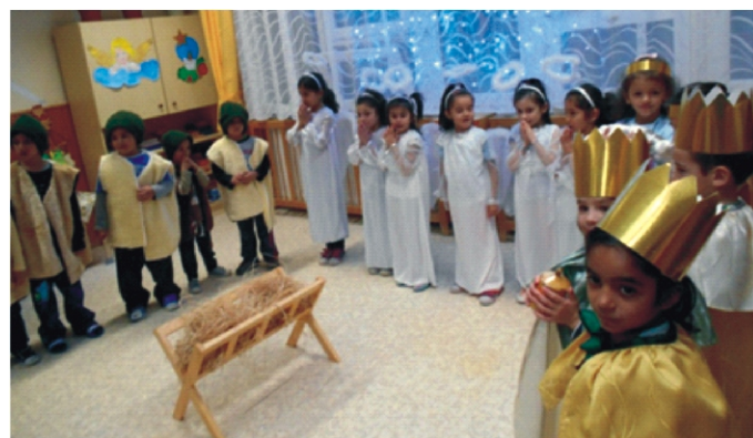
Izgottan várják a gyerekek, hogy kezdhesék a pásztorjátékot