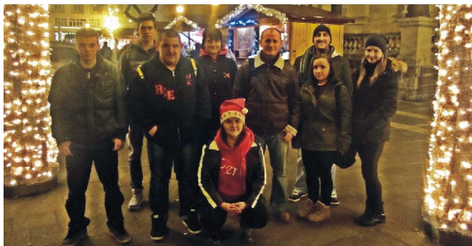
Az Adventi Vásár kapujában