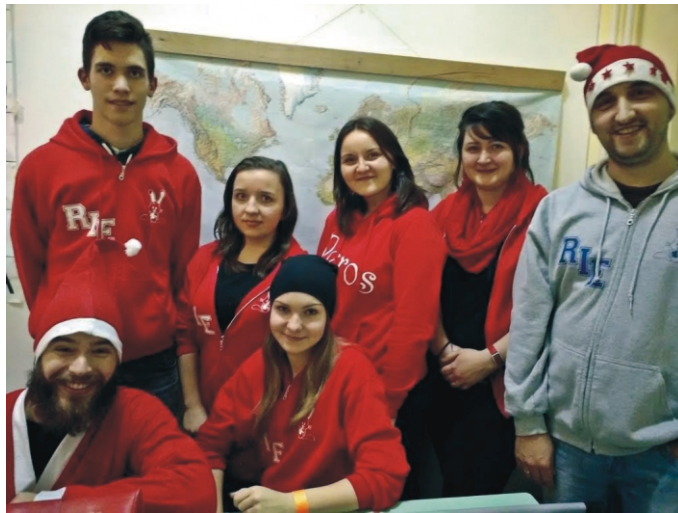
A szabadulósobából kijutott egyik csapat