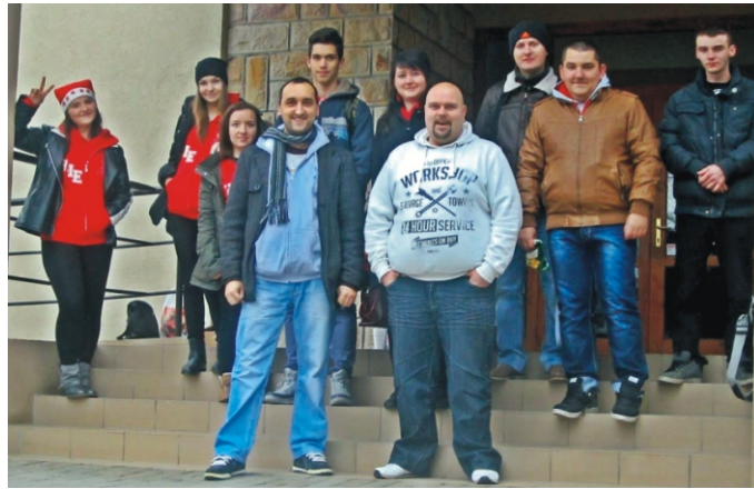
Csoportkép indulás előtt