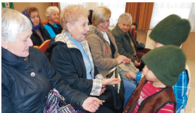
Egy kis ajándékkal is kedveskedtünk az időseknek