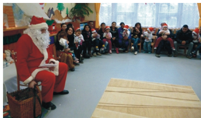
Mikulás-várás anyukákkal az „Alma” kiscsoportban

Idén decemberben az első Mikulás már szerdán megérkezett az óvodások nagy örömeire. A három csoport közösen várta őt énekkel, verssel, amit a gyerekek a Mikulást körbeállva adtak elő.