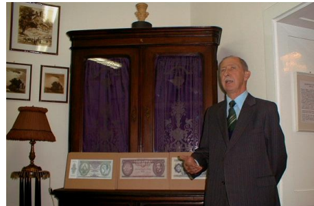
2004. október 15.