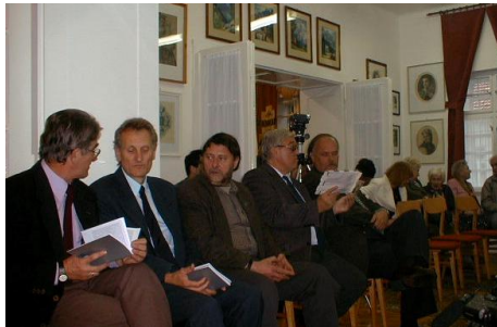
2005. október 15.