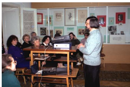
1992. március 23.