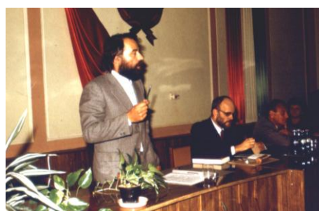
1986. szeptember 22.