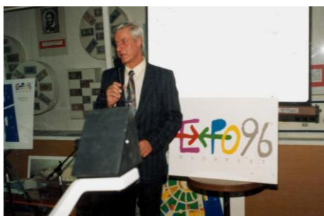
1994. március 28.