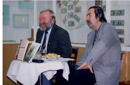
2004. február 3.