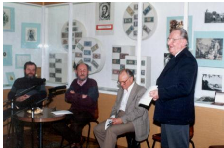
1994. február 11.