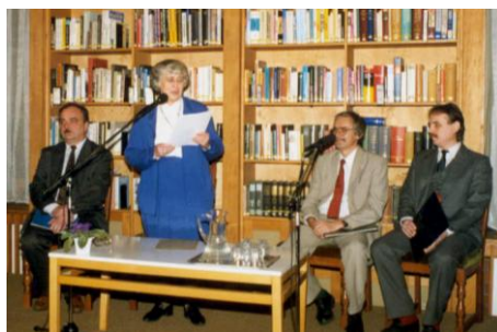
1996. november 21.