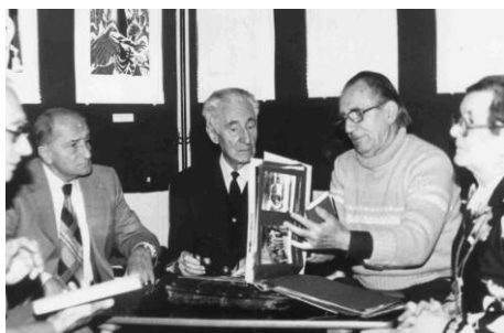
1983. szeptember 27.