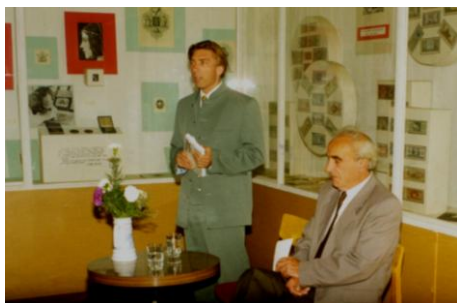
1998. augusztus 25.