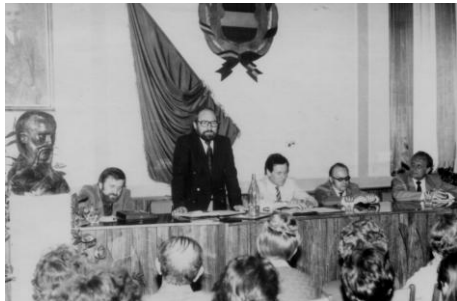
1983. április 25.