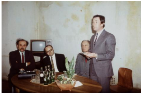
1981. március 7.