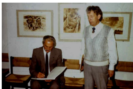
1988. november 19.