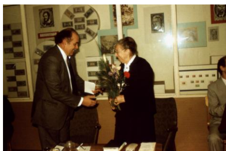
1990. november 19.