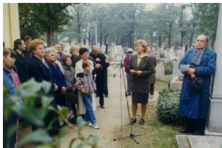
1997. október 21.