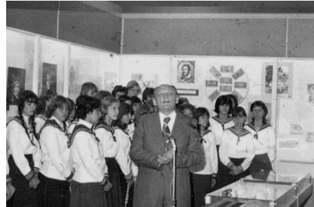
1980. október 18.