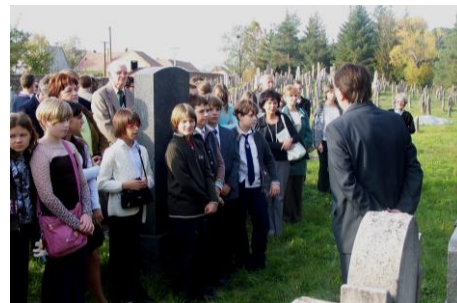
2008. október 14.