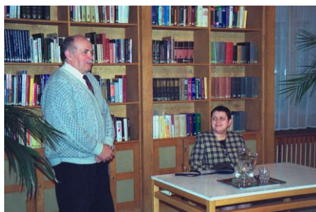
2002. március 19.