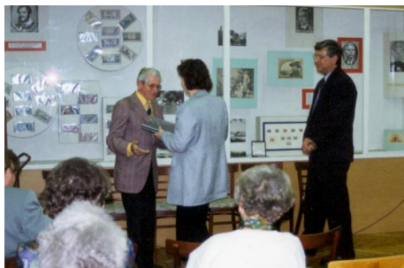
1999. április 8.