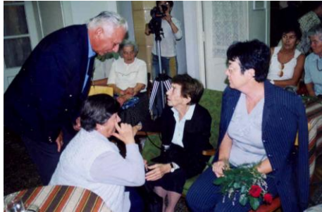
2003. szeptember 9.