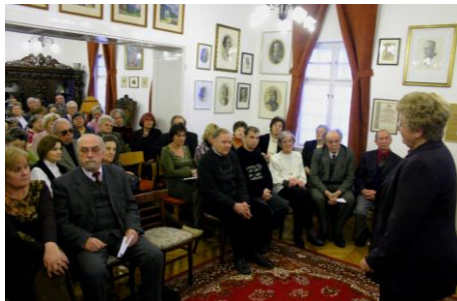
2006. február 7.