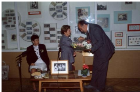
1993. szeptember 14.