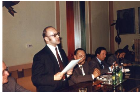
1982. március 18.