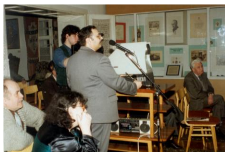
1995. március 7.