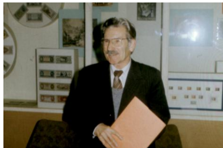
1987. november 21.