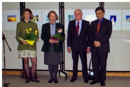
1998. október 14.