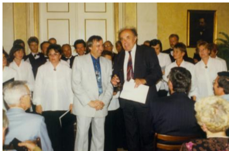
1997. szeptember 9.