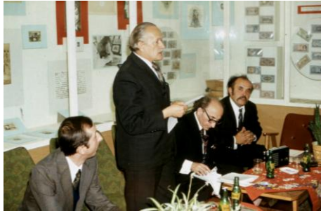
1979. október 13.