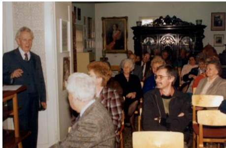
1995. május 9.