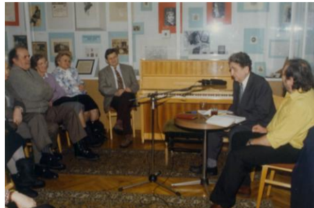
1996. február 13.