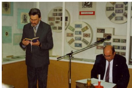
1999. november 2.