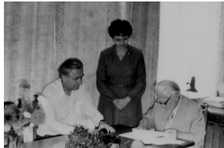
1983. augusztus 30.