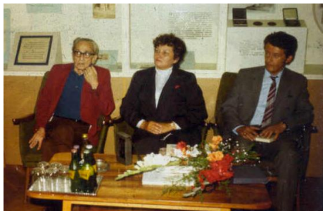
1987. szeptember 3.