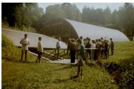
1988. június 25.