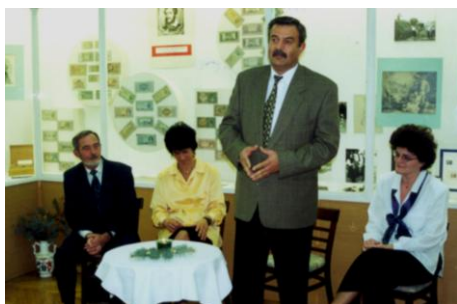
2000. december 12.