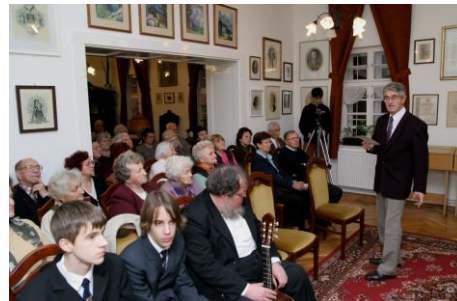
2007. november 28.