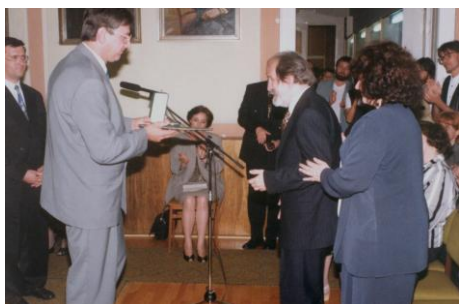
1996. május 28.