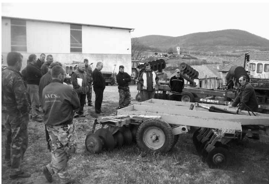
Mezőgazdasági erő- és munkagépképzők oktatása

A mezőgazdasági kis és középvállalkozások részéről gyakran megfogalmazódik, hogy nem találunk megfelelő képzettségű személyt, akik tízmillió értékű traktorait, kombájnjait működtetnék. Ezt a problémát pár hónap alatt sikerült megoldani, sőt tartalékok is képződtek. Összességében elmondható, hogy a megfogalmazódott igények szerint a mező- és erdőgazdálkodási vállalkozások 350–400 végzős szakmunkásnak