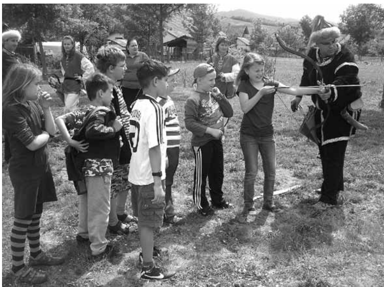
Az ifjú íjások

polgármesterasszonyunknak és az önkormányzati képviselőtestületnek, a program kidolgozásában és előkészítésében résztvevőknek, hogy megszépítették a gyermeknapot. Külön köszönetet érdemelnek azon egyesületek és állami szervek, akik a programban részt vettek.