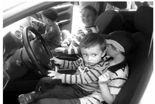
A jövő rendőrei

A közös ebéden a gyerekek virslit és üdítőt fogyaszthattak. Ez után következett a nap fénypontja, rengeteg élelmiszert, gyümölcsöt, édességet kaptak a gyerekek, ugyanis Nógrád Megyében egyedülként mi nyertünk a „Terülj-terülj asztalkám” gyermeknap pályázaton a Herencsény Sportegyesületen keresztül. Ezúton is köszönjük a Fülöp-Hús Kft-nek, Palóc-Coop Zrt-nek, DL-BROT Kft-nek,