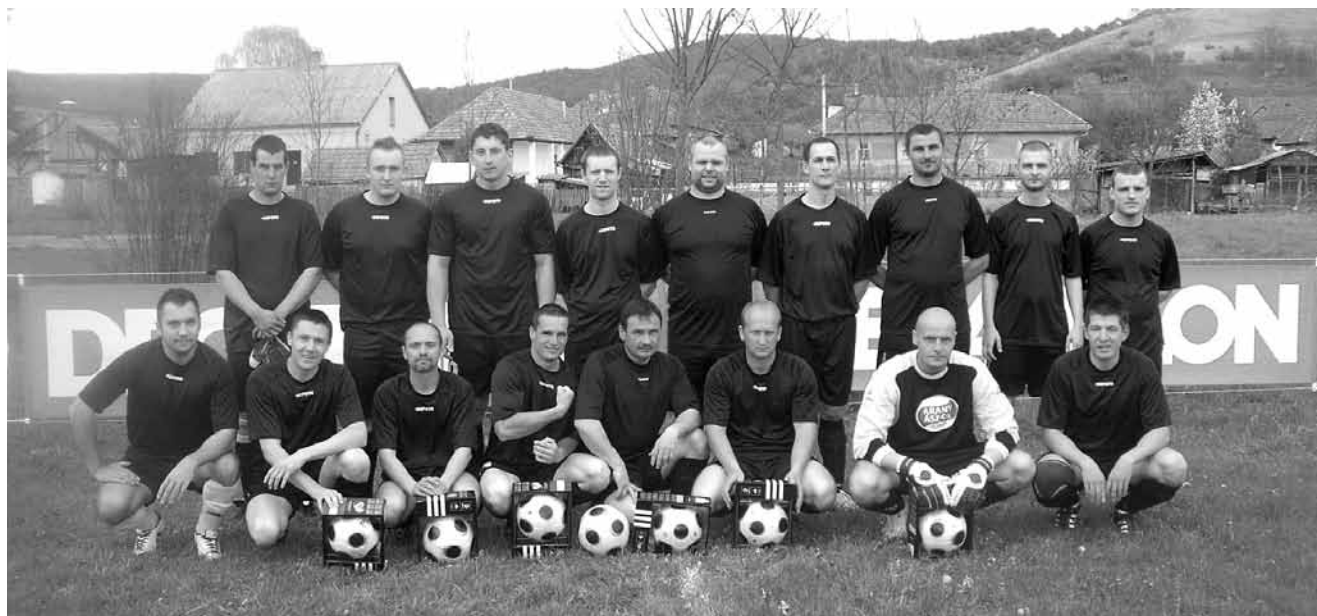
Az új felszerelésben a csapat az új labdákkal együtt