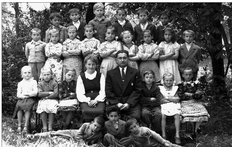
1. osztályosok Herencsényben az 1959–60. tanévben