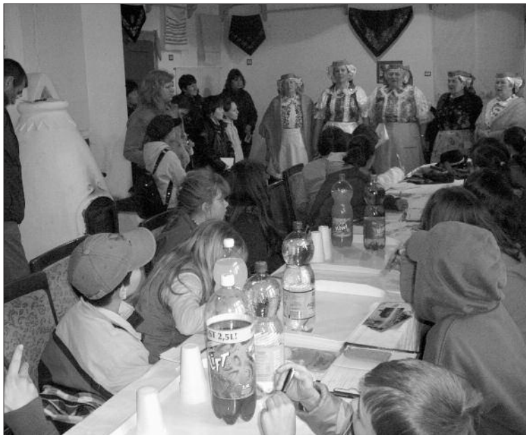
Ismerkedés a viselettel

A gyerekek feladata az volt, hogy a három témában bemutatóval egybekötött ismertetőt kaptak,