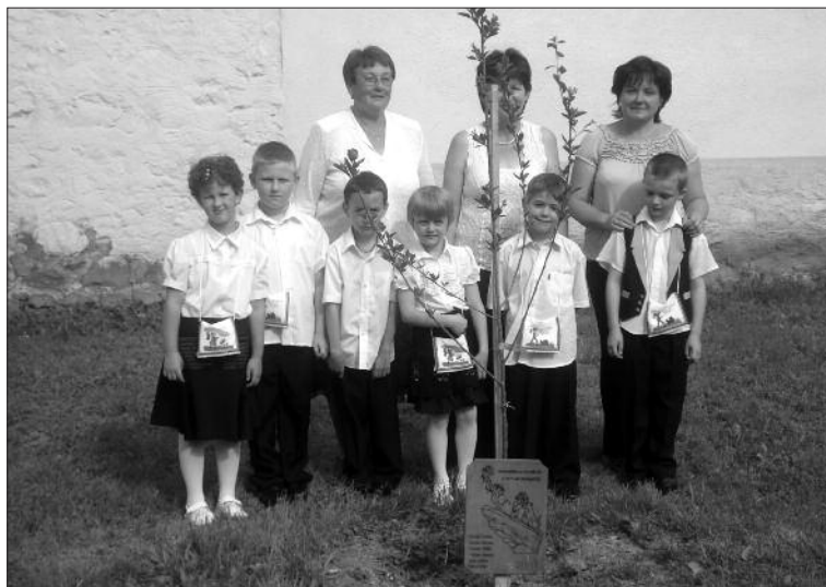
A ballagó ovisok fája

Az idei év sem múlhatott el nagy csoportos ballagás nélkül. Az óvodából búcsúzó gyermekek ez alkalomból egy kis búcsúajándékkal kedveskedtek a kisebbeknek és nevelőiknek: szilvafa csemetét vásároltak, melyre egy emléktáblát is