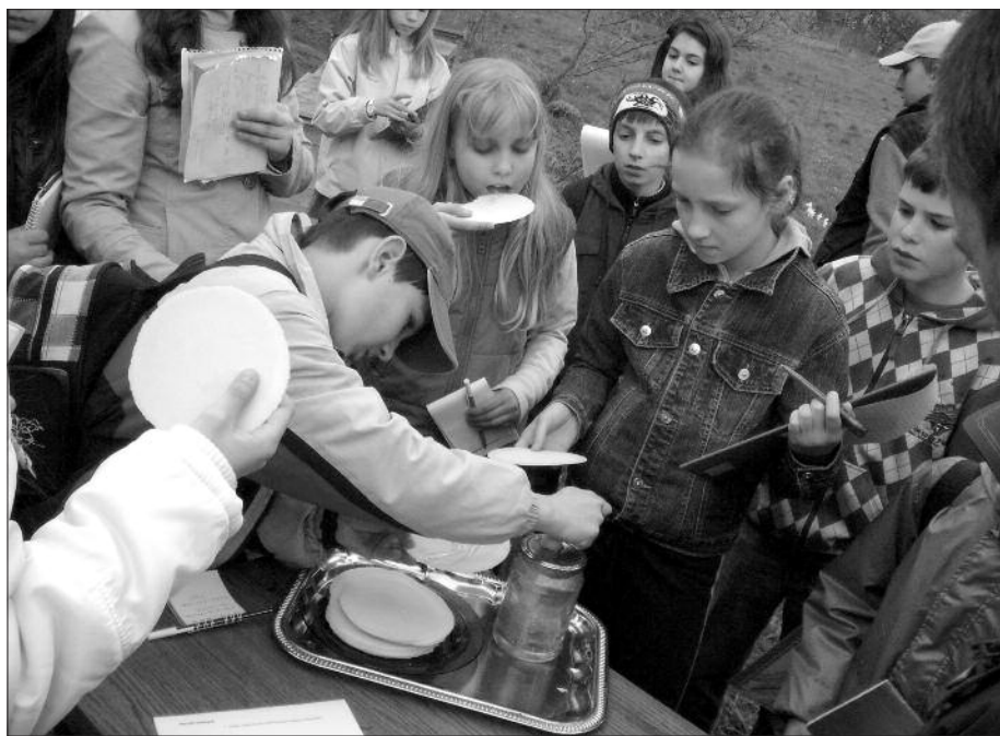
Milyen a Szandai méz?

Utolsó témaként a gyógynövények világába adtam rövid bepillantást és kicsit közelebbről (mindenki kapott egy-egy kis zacskónyi mintát is) megismerkedtünk az orvosi zsá-