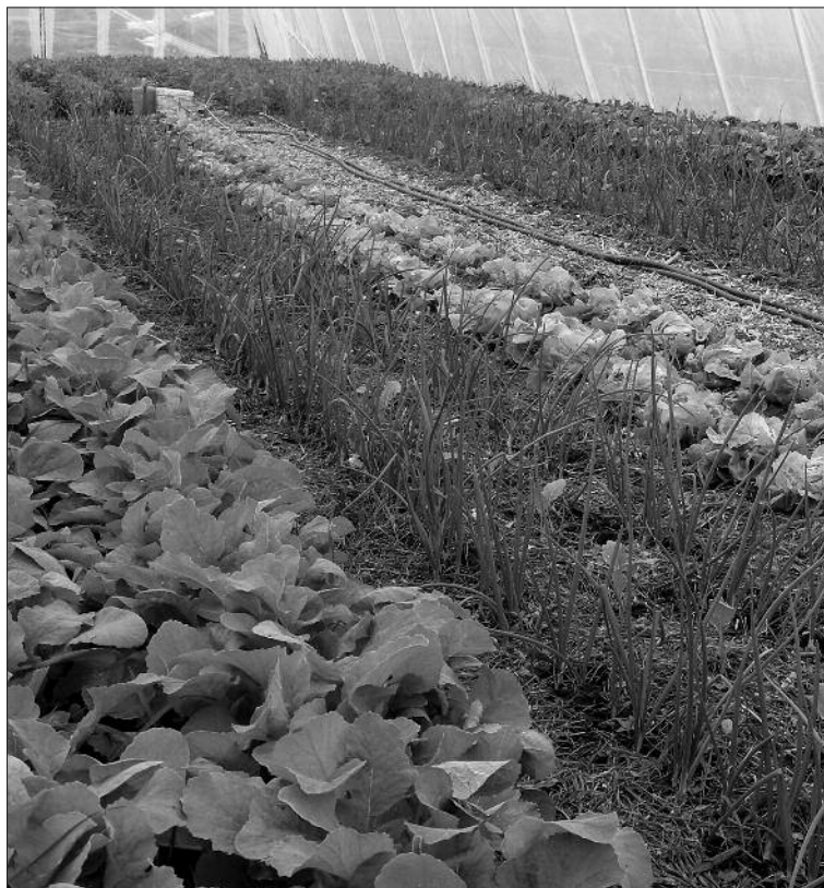
Az ökokert első termései