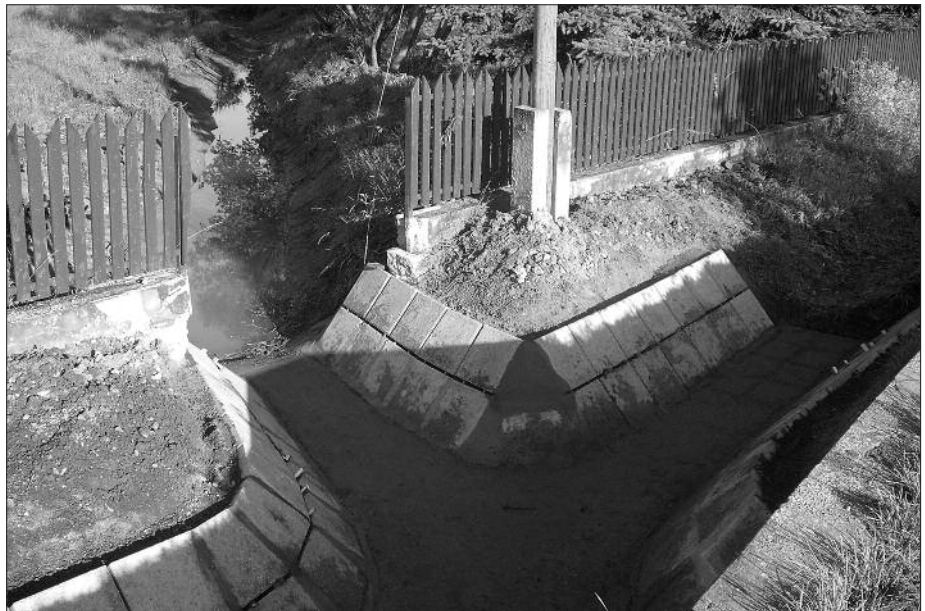
Kész az árok a Béke utcában

Reméljük a pályázatok sikeresek lesznek és az elkövetkező években ezek az árvízvédelmi rendszerek és vízrendezések biztosítják majd Herencsény és környékének csapadék elvezetését.