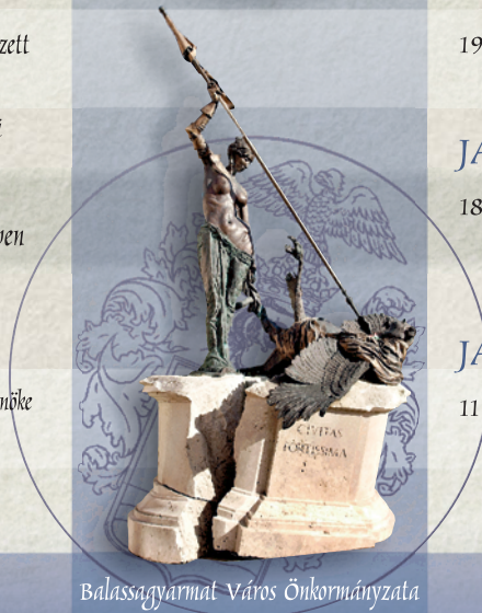
Balassagyarmat Város Önkormányzata