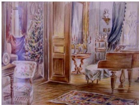
Biedermeier interiőr (interior)

natisztként harcolt az 1848–49-es szabadságharcban és 1849-ben megsebesült Erdélyben. Felesége utánament, hogy hazasegítse a sebesültet, útban hazafelé azonban