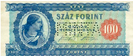
100 Forint, 1946

Inflation accelerated in 1945, thus banknotes of always higher denominations