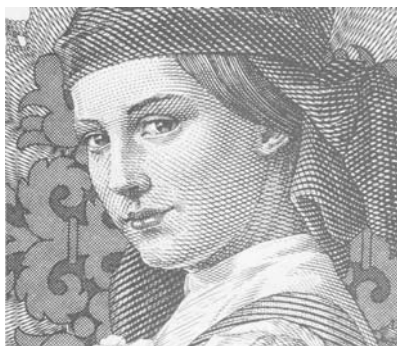
5 Pengő (Részlet – Detail)

Az 1930-as években a bankjegyhamisítás ellen Magyarországon rotációs réznyomógépeket fejlesztettek ki, amelyek lehetővé tették a finom vonalak élességének és a na-