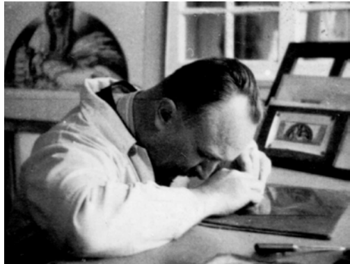
Munkában – At work