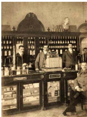
Magyar Korona Gyógyszertár Pharmacie Hungarian Crown